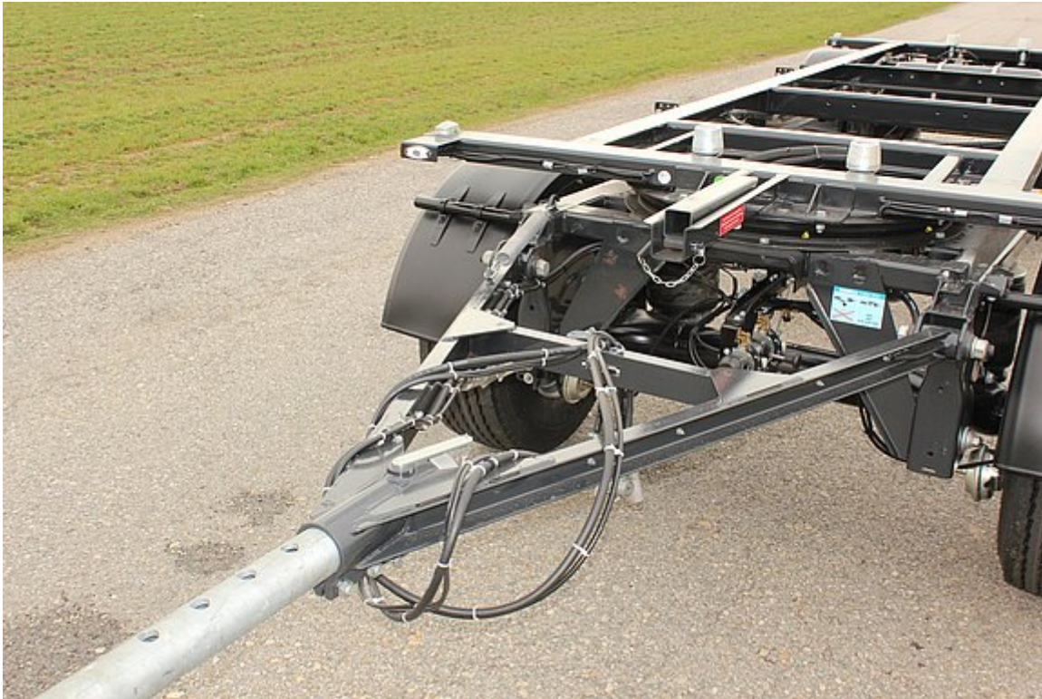
OPTIONAL: Ausziehbare Zuggabel, max. 600 mm verstellbar, mit Getofix-Deichselstütze