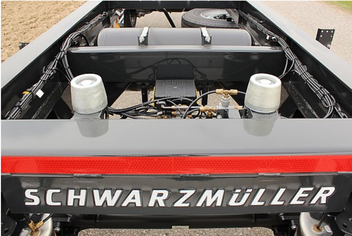
4 Stk. Einweisrollen