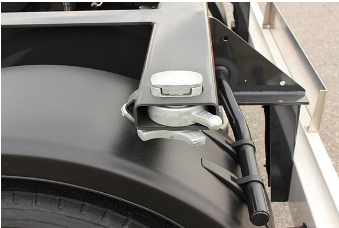
Auflagräger samt 4 Containerverschlüsse nach EN 284 (20ft-Verriegelungsmaß)