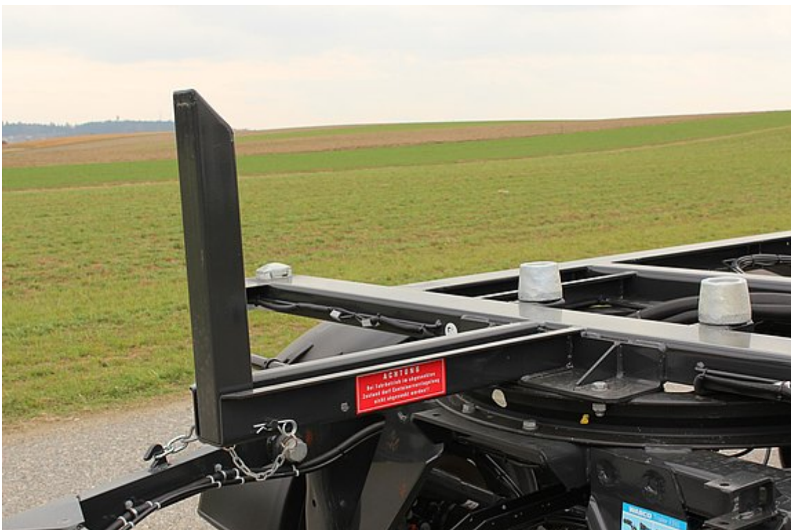
Anschlagstützte vorne umleg- und umsteckbar